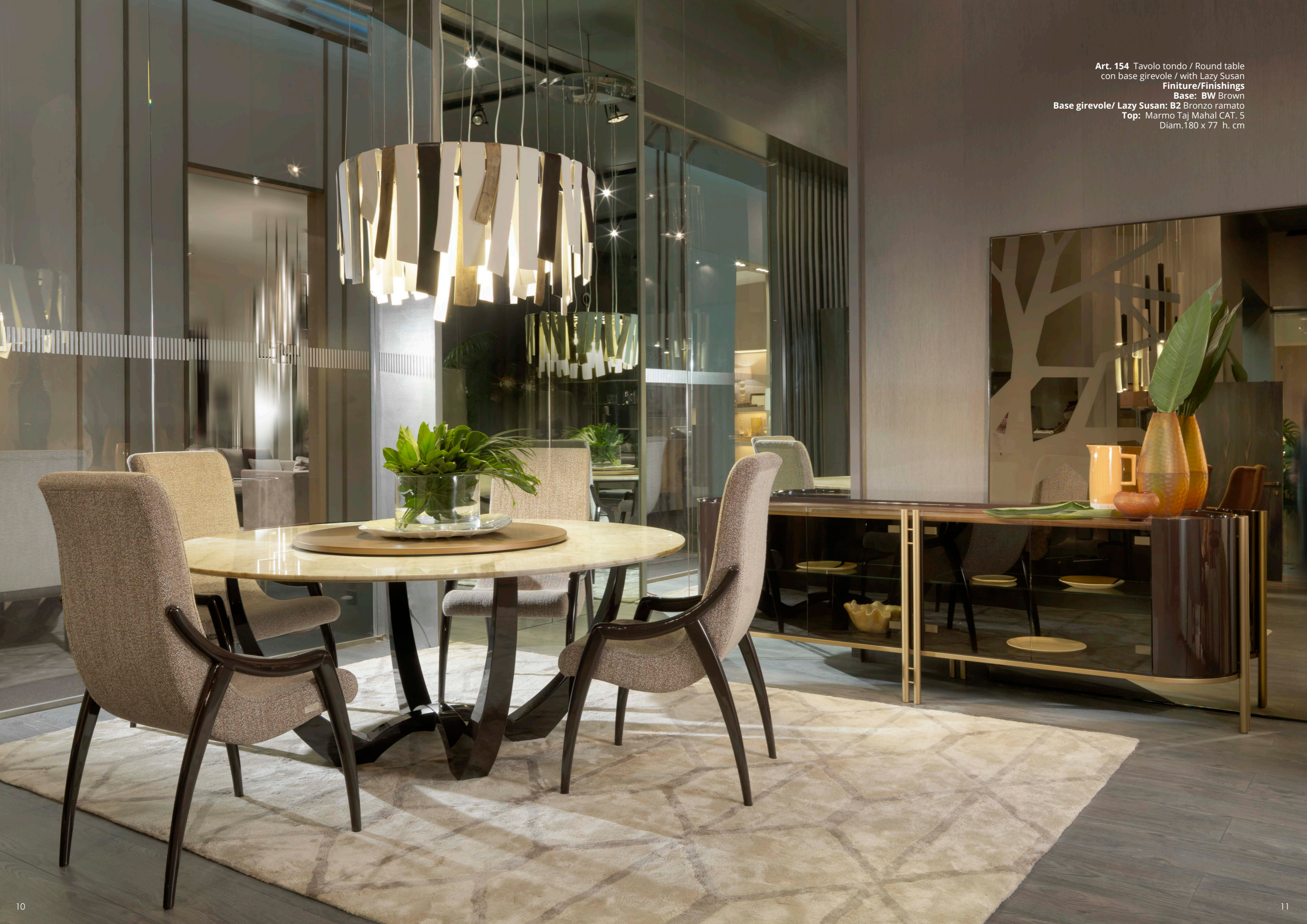
Art. 154 Tavolo tondo / Round table con base girevole / with Lazy Susan Finiture/Finishings Base: BW Brown Base girevole/ Lazy Susan: B2 Bronzo ramato Top: Marmo Taj Mahal CAT. 5 Diam. 180 x 77 h. cm