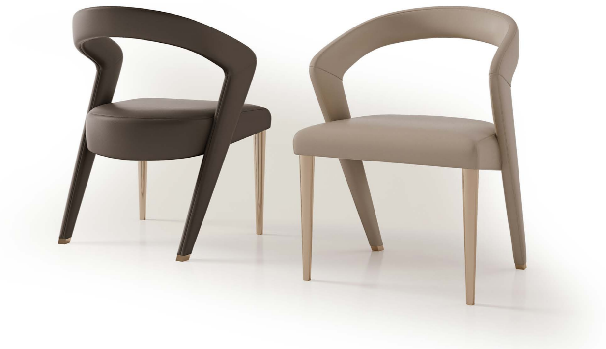
Art. 6060 Sedia / Chair Finiture / Finishing: B1 Bronzo antico Pelle / Leather: Vogue black 6028 (left) Vogue white 6038 Cat. C (right) 63 x 59 x 84 h. cm