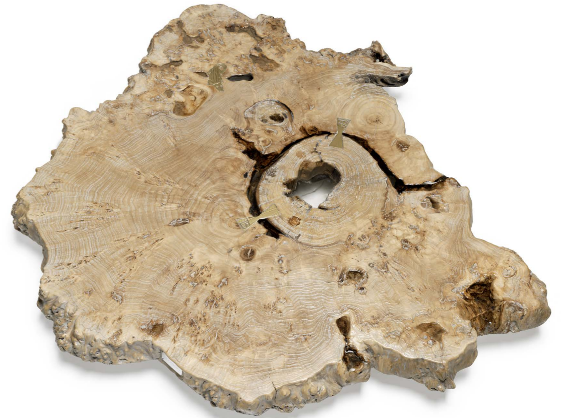
Art. 114 Z Tavolino / Coffee table Finiture/Finishings: 10 Radica natural Diam. 150 cm