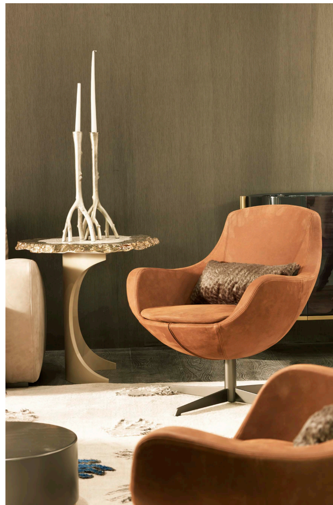
Art. 6042 Poltrona/Armchair Pelle/leather: Atlantis Col. 34 CAT. C Gambe/Legs: CF Canna di fucile 75 X 77 X 78 h. cm