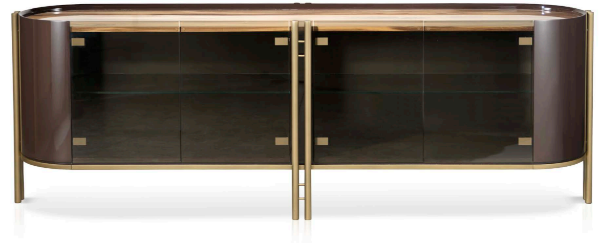
Art. 986 Credenza/Sideboard 4 ante in vetro/4 glass doors Finiture/Finishing: TB Flamme terra bruna + BW Brown + B1 Bronzo antico 244 x 57 x 81 h. cm