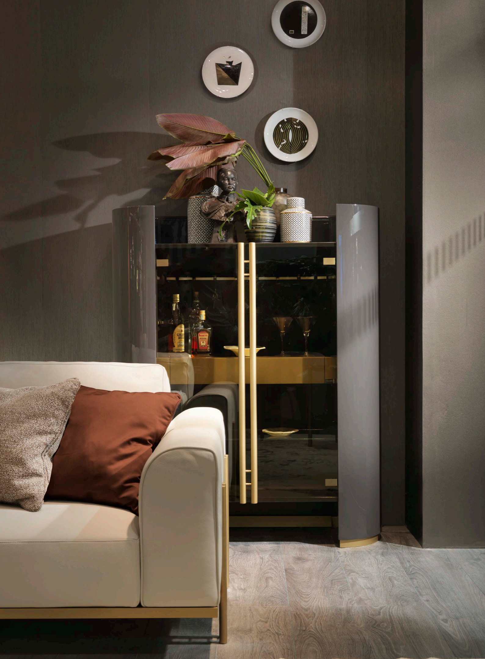
IKAT Bar cabinet