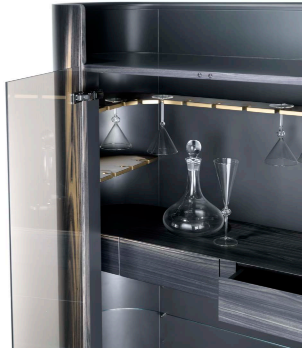
Art. 982 Mobile Bar/Bar Cabinet Finiture/Finishing: SP Seppia + B1 bronzo antico (left) BN Flamme blu notte + B1 Bronzo antico (above) 125 x 44 x 155 h. cm