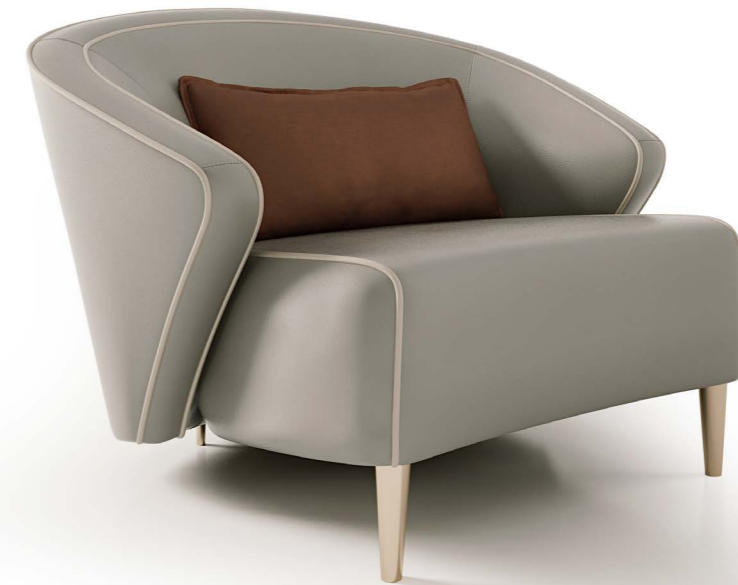
Art. 6061 Poltrona / Armchair Pelle/Leather: Vogue 6024 CAT. C Cordoncino/ Cord: Vogue 6038 CAT. C Gambe/Legs: B1 Bronzo antico 75 X 77 X 78 h cm