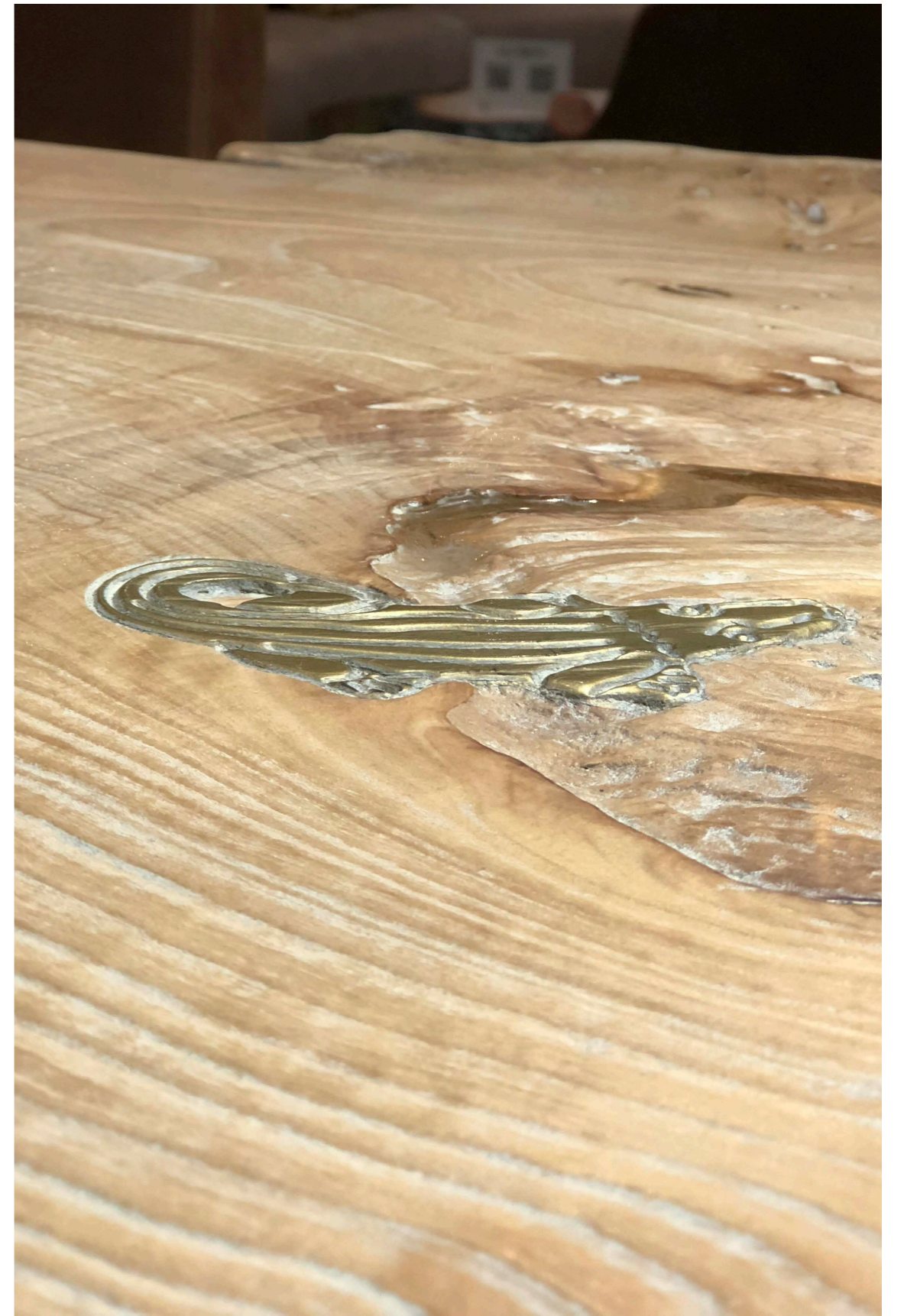
Art. 991 Mobile cantina / Wine cabinet Finiture/Finishing: TB Flamme terra bruna + BW Brown + BD Bianco Dune 291 x 40/60 x 225 h. cm