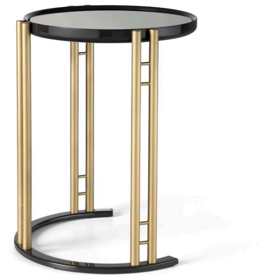
Art. 166 Tavolino / Lamp table Finiture/finishings: SP Seppia + B1 bronzo antico Top: specchio bronzo / bronze mirror Diam. 55 x 66 h. cm