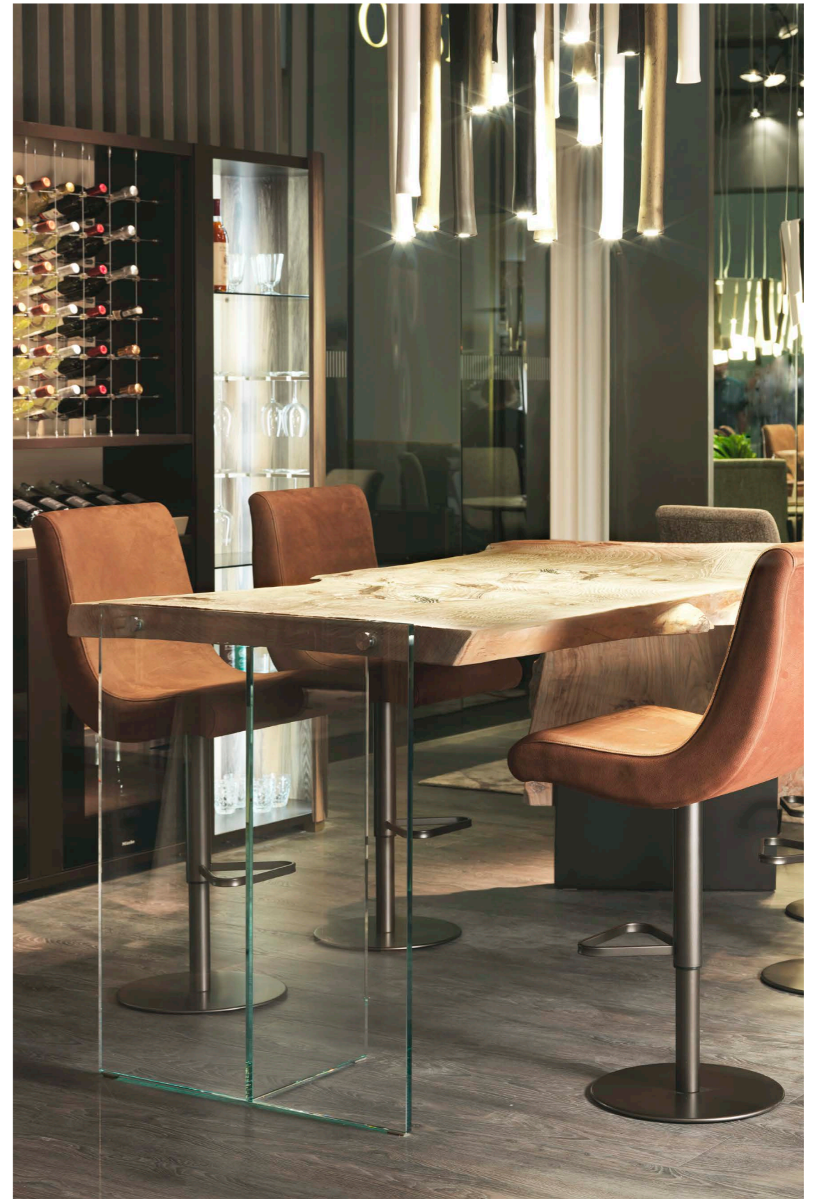
Art. 108 BX Bancone Bar / Bar Counter Finiture/Finishing: 10 Radica natural + BW Brown + vetro/glass 265 x 100 x 100 h. cm