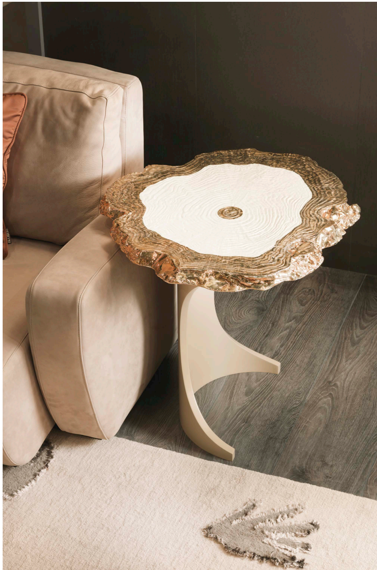
GEO lamp table