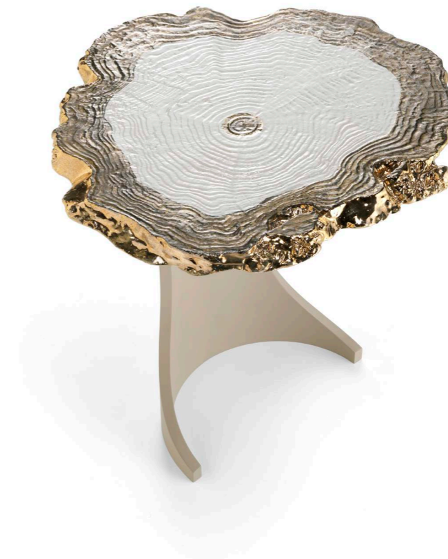
Art. 145 Tavolino / Lamp table Base: BD Bianco Dune Top: Ceramica / Ceramic GEO white - bronze Diam. 65 x 66 h. cm