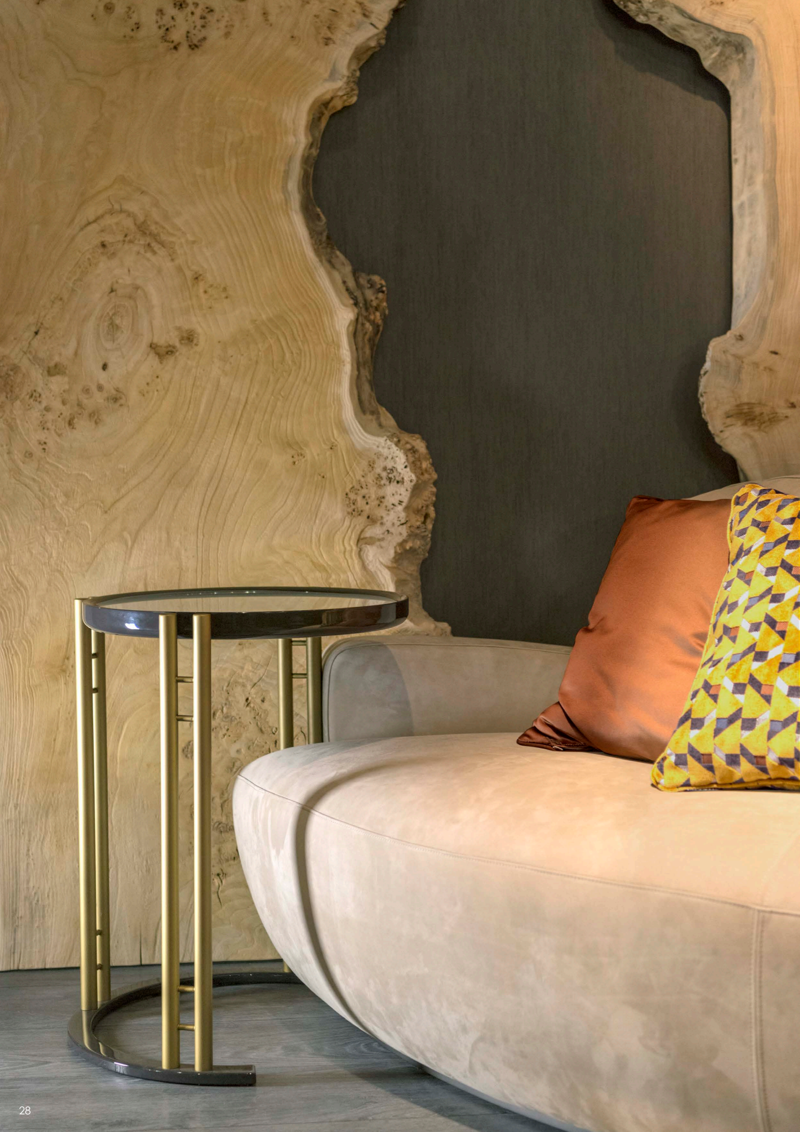
IKAT lamp table