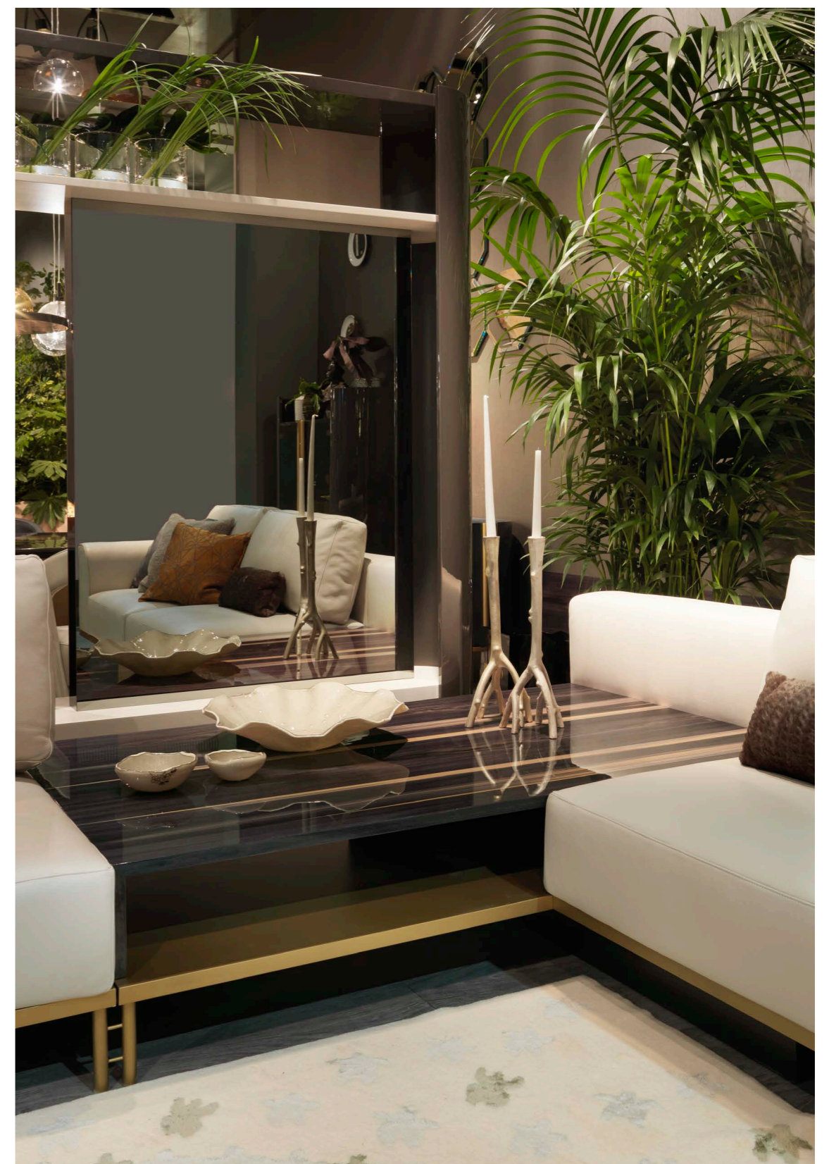
Art. 992 Mobile TV / TV Cabinet Finiture/Finishing: SP Seppia + BD Bianco dune + B1 Bronzo antico 355 x 40 x 225 h. cm

Available in 2 versions: BASIC (with glossy lacquered panel for standard TV up to 46") PLUS (equipped with mirror TV on the front side and mirror on the back side)