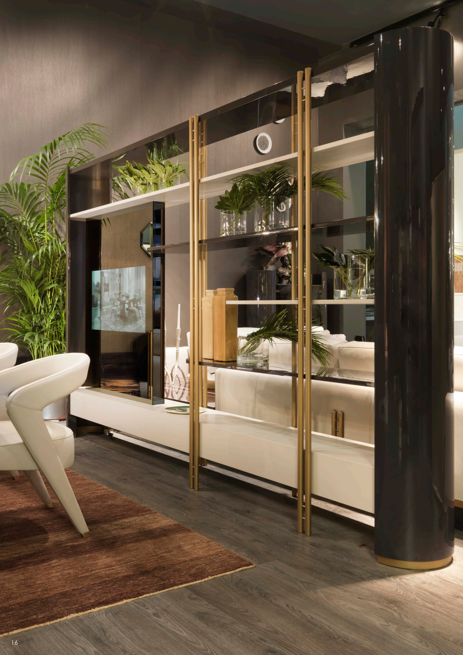
IKAT TV Cabinet