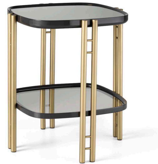
Art. 167 Tavolino / Lamp table Finiture/finishings: SP Seppia + B1 Bronzo antico Top: Specchio bronzo/bronze mirror Diam. 57 x 65 h. cm