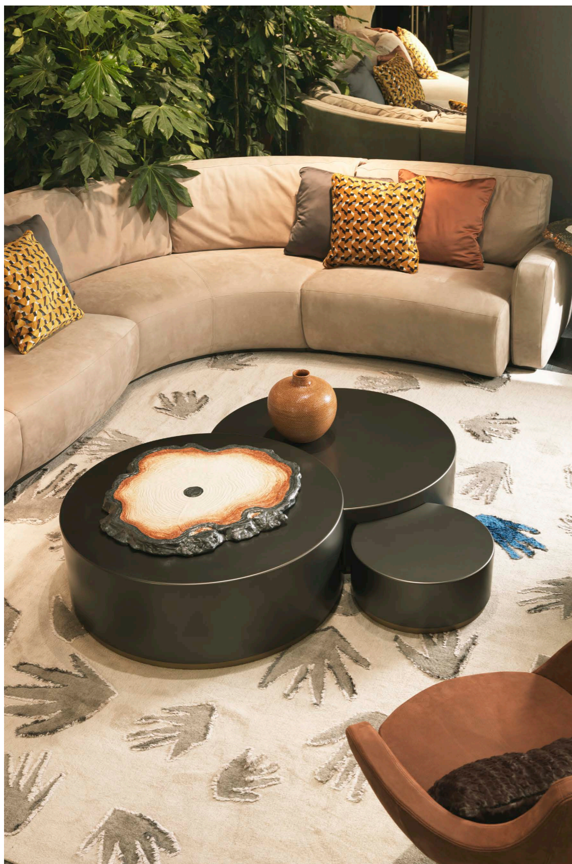
Art. 165 Tris Tavolini Top: CF Canna di fucile Base: B1 Bronzo antico 1 - 95 x 34 h. cm 2 - 95 x 27 h. cm 3 - 48 x 21 h. cm