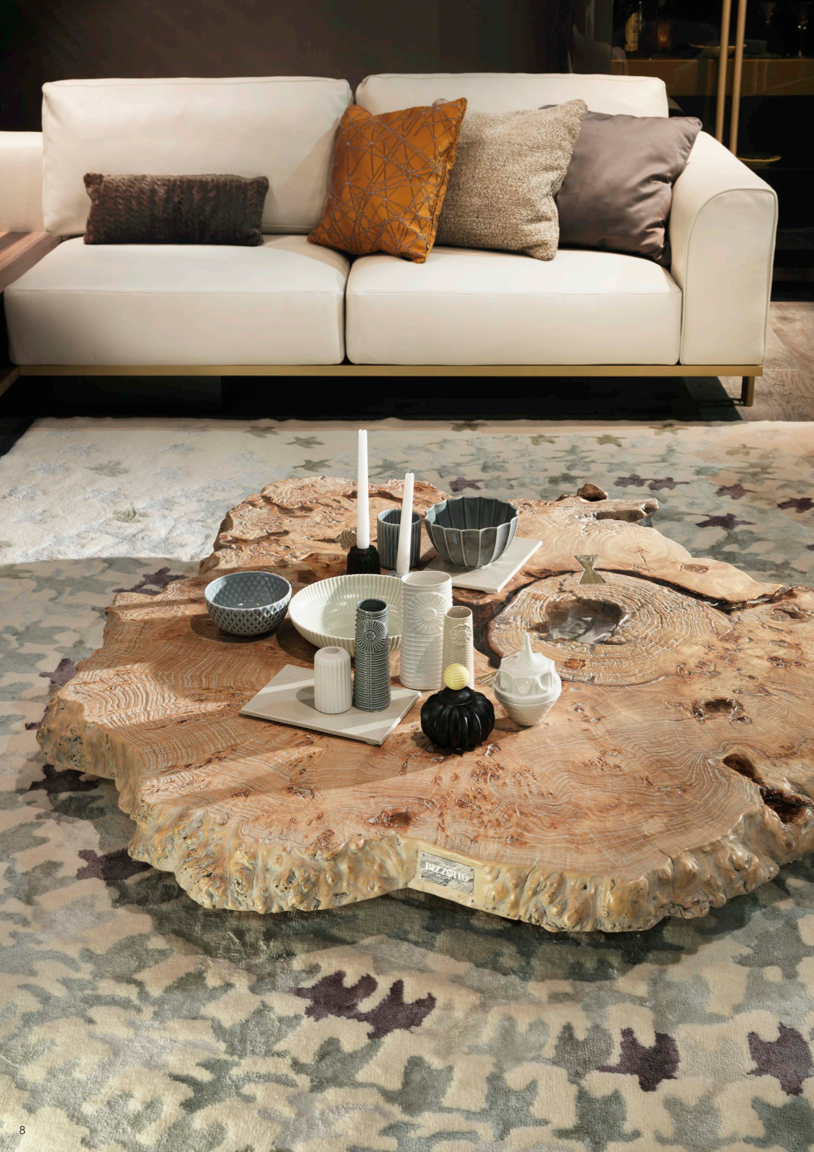
SIDNEY coffee table