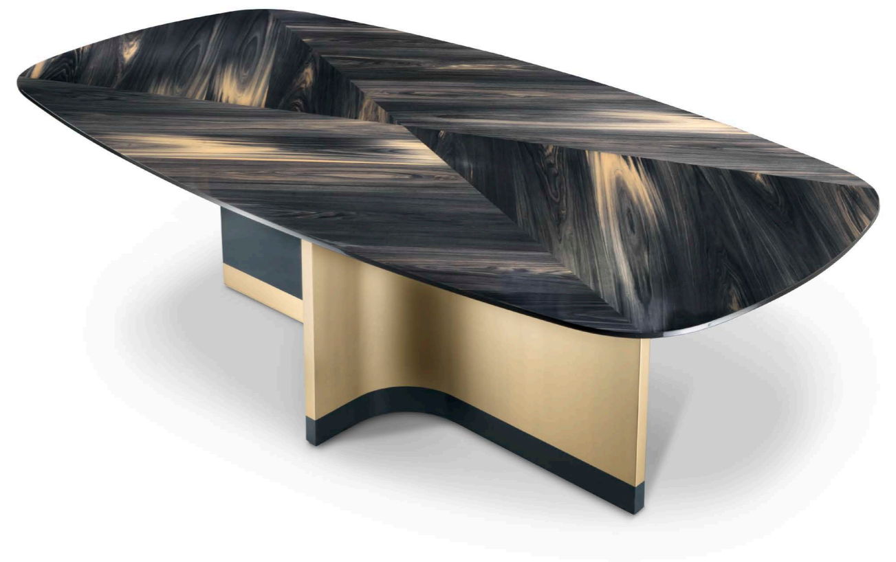
Art. 164 Tavolo / Table Base: B1 Bronzo antico + AO Blu avion Top: BN Flamme blu notte 250 x 130 x 77 h. cm