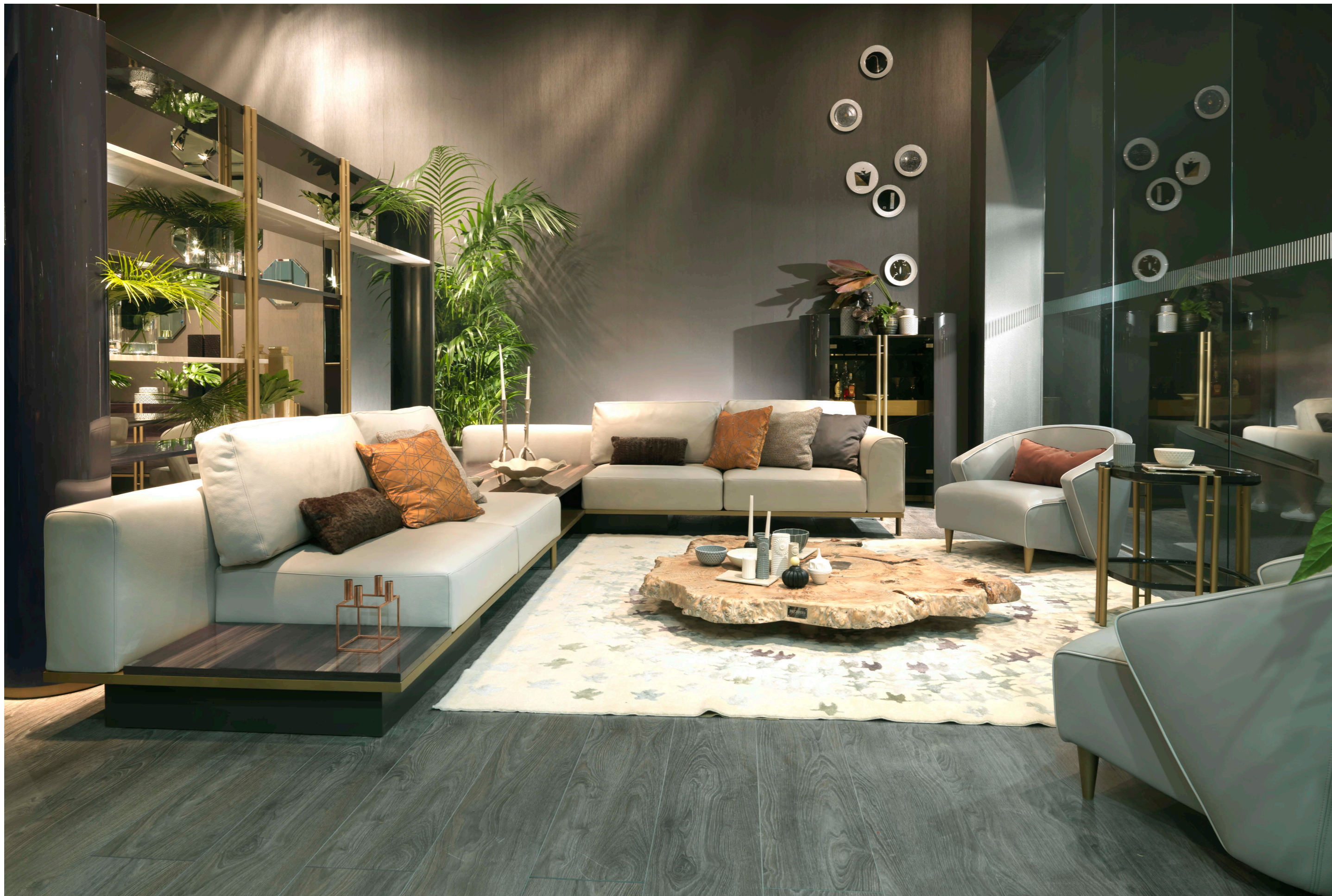
Art. 6085 Divano componibile / Modular sofa Finiture/Finishing: BN Flamme blu notte + B1 Bronzo antico + SP Seppia Pelle/Fabric: Vogue 6038 CAT. C 420 x 310 x 65 h. cm