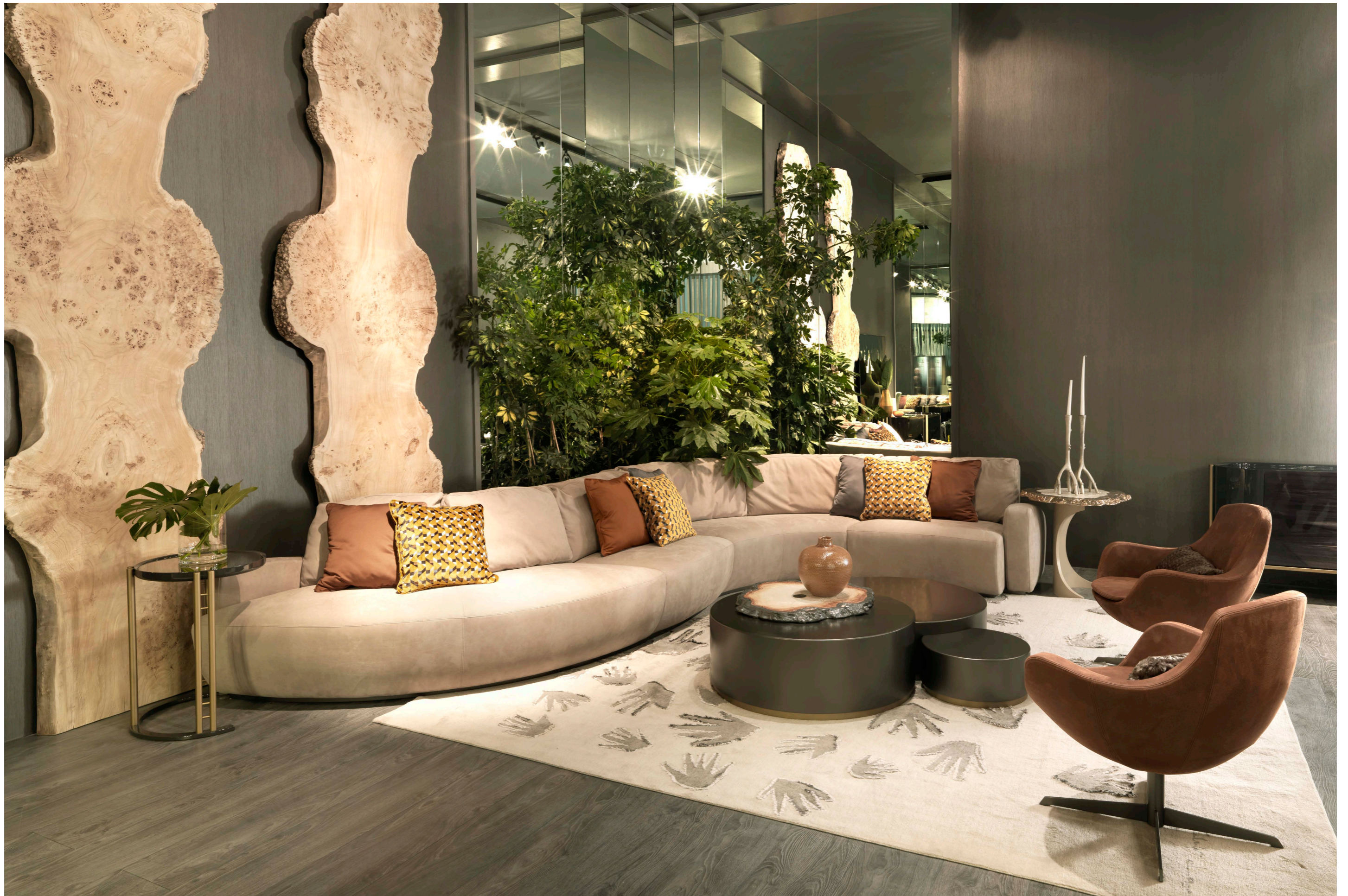
Art. 6095 Divano componibile / Modular sofa Finiture/Finishing: B1 Bronzo antico Pelle/Fabric: Nabuk 15 CAT. C